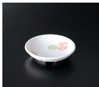
M-712EH 小皿 ㊦ 88×21 50cc ¥400