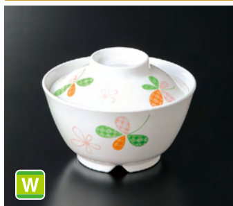
GA-223EH 飯丼(身) ㊦ 130×69 ㊦ 91 500cc ¥1,050 G-224EH 飯丼(蓋) 117×34 ¥530