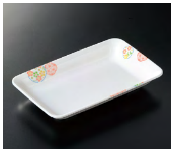
M-136EH 角皿 ㊦ 182×113×27 ¥980 🍷 K-190 ¥450 ㊦ 52