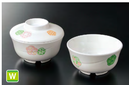
M-702EH 丸小鉢(身) ㊦ 110×55 ㊦ 79 280cc ¥940 Y-142FEH 丸小鉢(蓋) 110×31 ¥620 共用蓋 A