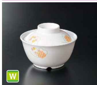
GA-227EH 飯丼(身) ㊦ 115×59 ㊦ 81 330cc ¥920 G-228EH 飯丼(蓋) 102×31 ¥520