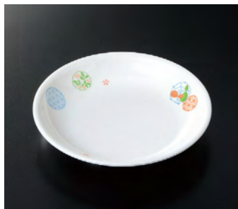
G-477EH 16.5cm丸皿 ㊦ 165×29 ¥810 🍷 P-203 ¥370 ㊦ 63