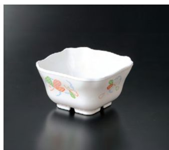
M-138EH 角小鉢 ㊦ 95×95×52 220cc ¥900 🍷 P-216 ¥340 ㊦ 71