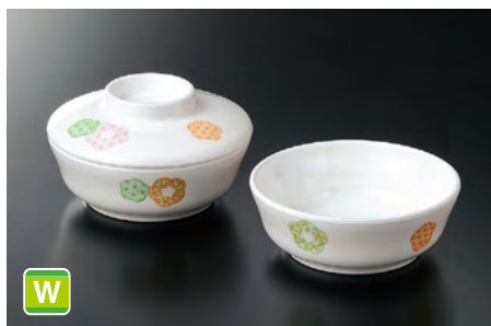
M-228EH 丸小鉢(身) ㊦ 110×39 ㊦ 64 200cc ¥1,000 Y-142FEH 丸小鉢(蓋) 110×31 ¥620 共用蓋 A