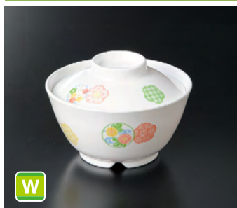
GA-225EH 飯丼(身) ㊦ 125×66 ㊦ 85 450cc ¥970 G-226EH 飯丼(蓋) 113×31 ¥530