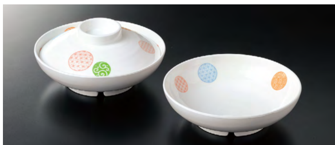
G-317EH 煮物碗(身) ㊦ 162×47 ㊦ 74 490cc ¥1,260 G-114EH 煮物碗(蓋) 150×39 ¥590